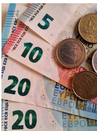
Praní špinavých peněz