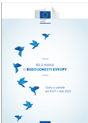
Bílá kniha o budoucnosti Evropy